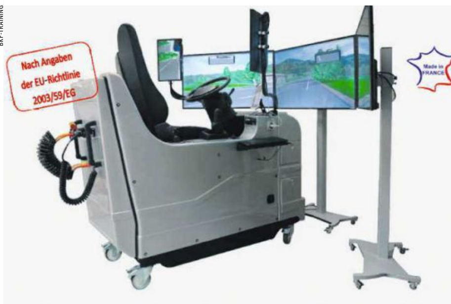
Der Fahr-Simulator kommt auch bei den Kundinnen und Kunden gut an